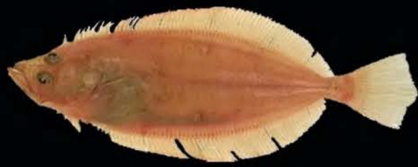
Cardine franche Lepidorhombus wiffiagonis

Centre Manche-Mer du Nord - Département Halieutique Laboratoire Ressources Halieutiques de Boulogne sur mer. Pôle de Sclérochronologie