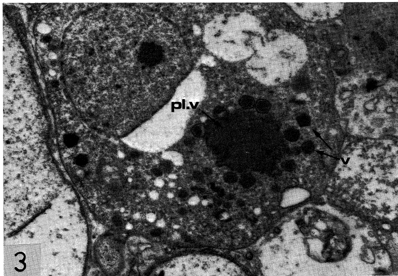
Ultrastructure / ultrastructure