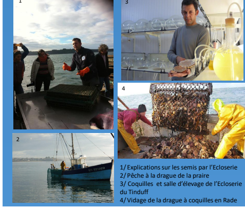
1/ Explications sur les semis par l'Écloserie 2/ Pêche à la drague de la prairie 3/ Coquilles et salle d'élevage de l'Écloserie du Tinduff 4/ Vidage de la drague à coquilles en Rade

Une zone soumise à des stress multiples, subissant les interactions entre eutrophisation, changement climatique, prolifération d'espèces invasives, perturbations anthropiques.