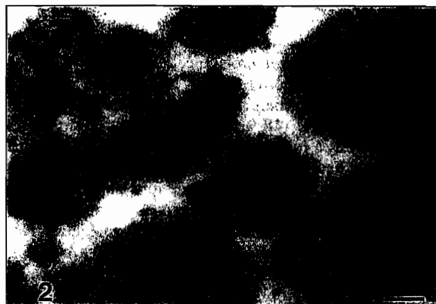
Figure 2. Particules virales de type herpétique observées dans le tissu conjonctif du manteau d'une larve d'huître creuse, Crassostrea gigas (barre : 50 nm).

Ces descriptions multiples reflètent le caractère ubiquitaire de cette famille de virus chez les mollusques. Une étude comparative de l'ensemble des virus apparentés aux Herpesviridae décrits chez les bivalves a été récemment réalisée [3]. Du point de vue de leurs dimensions, en