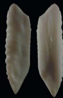
Faces concave et convexe de l'otolithe

Poisson qui acquiert sa maturité sexuelle entre 2 et 5 ans et sa longévité serait de 14 ans.