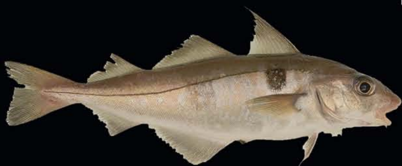
Eglefin Melanogrammus aeglefinus

Centre Manche-Mer du Nord - Département Halieutique Laboratoire Ressources Halieutiques de Boulogne sur mer