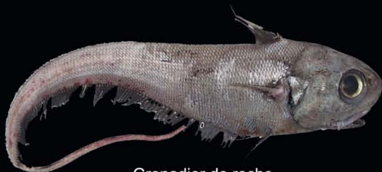
Grenadier de roche Coryphaenoides rupestris

Centre Manche-Mer du Nord - Département Halieutique Laboratoire Ressources Halieutiques de Boulogne sur mer