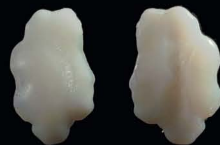
Faces concave et convexe de l'otolithe

Poisson à durée de vie longue estimée à 60 ans avec une croissance lente.