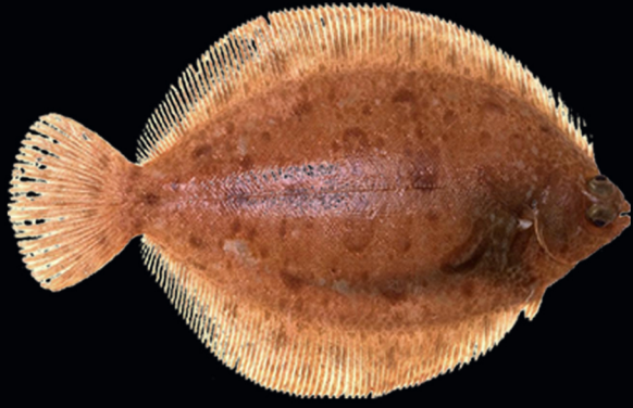
Limande sole Microstomus kitt

Centre Manche-Mer du Nord - Département Halieutique Laboratoire Ressources Halieutiques de Boulogne sur mer