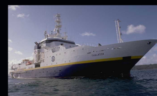
Le N/O Thalassa

Les poissons sont prélevés au premier trimestre pendant la campagne scientifique IBTS (International Bottom Trawl Survey) au mois de janvier au bord du N/O Thalassa.