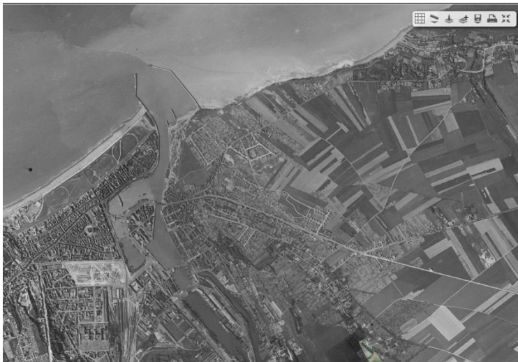
Dieppe - Photographie ancienne de 1944

La précision obtenue offre au grand public un rendu visuel permettant d'apprécier en particulier toutes les évolutions de la zone côtière en les superposant à des données plus récentes, comme les orthophotographies aériennes. Elles prennent alors une très grande valeur historique et patrimoniale. Ces photos anciennes apportent tout leur intérêt dans les études scientifiques abordant les problématiques liées à l'urbanisation, aux activités humaines ou encore à l'érosion de nos côtes.