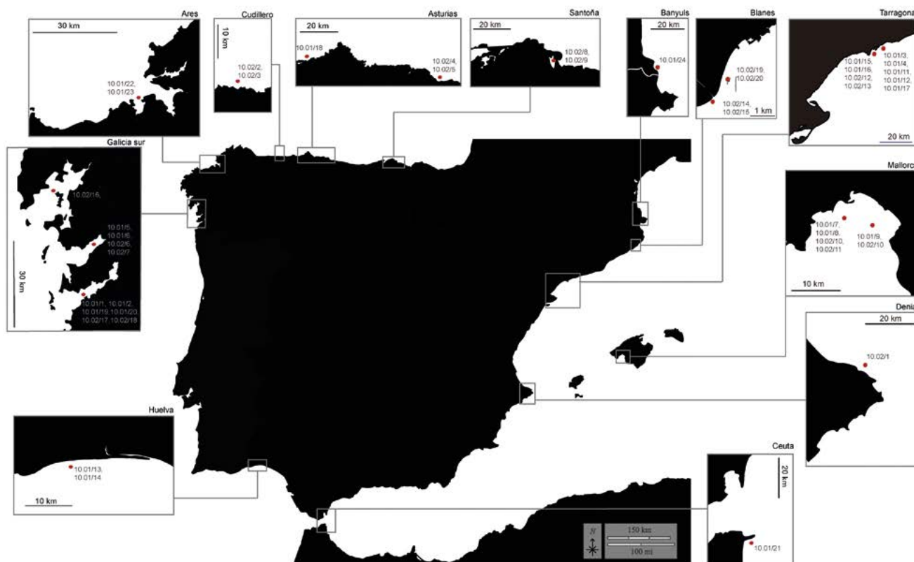
Fig. 1.– Mapa de los puntos de recolección de los ejemplares donados. Los recuadros ofrecen un mayor detalle de las localidades de muestreo. Los puntos de recolección se encuentran marcados en rojo. Los números al lado de los puntos de recolección indican el ejemplar o ejemplares recolectado(s) en el mismo.