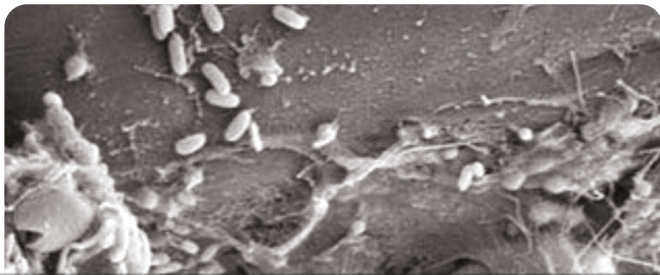
Image au microscope électronique de vibrios associés à des morceaux de plastique flottants

On sait, par exemple, à la suite au tsunami de 2004 en Asie du Sud Est qui a charrié des millions de tonnes de déchets en mer, que 6 ans après, au gré des courants, les côtes d'Amérique du Nord ont reçu ces déchets sur leurs littoraux et près de 300 espèces exotiques, fixées notamment sur les plastiques, invasives et non connues sont arrivées. La science ne connaît pas les conséquences de ces apports biologiques particuliers. C'est principalement sur les risques portés par des bactéries que se focalise la recherche.