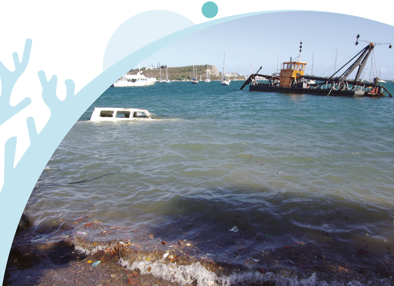
Carcasses de bateaux abandonnés, ici en Baie de la Moselle : du métal, certes mais aussi de la fibre et des plastiques...