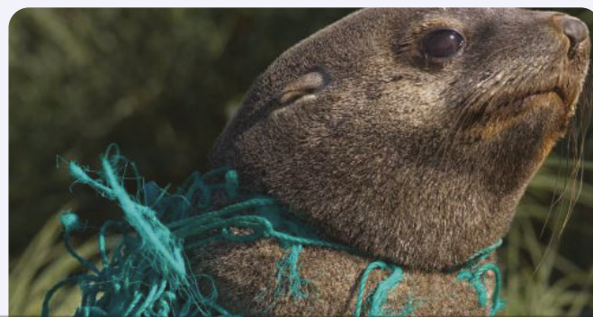
Phoque dans un filet de pêche

Emmêlements, ingestion et transport d'espèces sont les principaux impacts sur la faune marine. Le relargage de produits chimiques existe mais elle est une voie mineure de cette contamination.