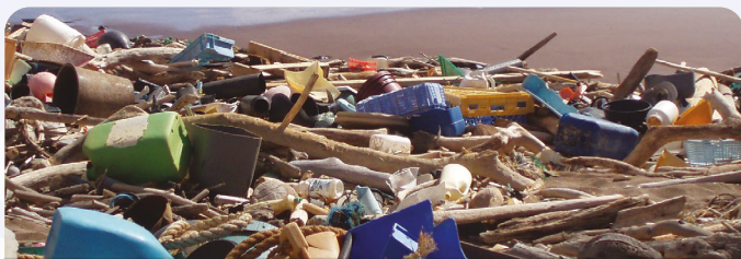
Déchets dans une lisse de haute mer.

Certes cette pollution se concentre sur le littoral dans ce qu'on appelle les lisses de haute mer où elle est visible et parfois de façon spectaculaire.