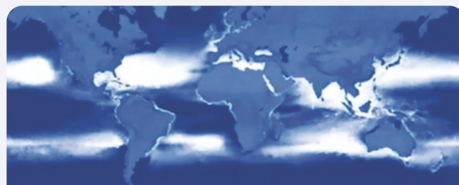
Distribution des micro plastiques à la surface de l'océan : en blanc les plus fortes concentrations : celle des gyres !