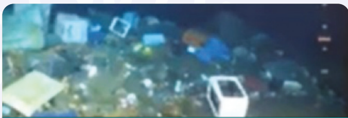
Déchets tapissant les fonds marins en Méditerranée.

Cependant il faut savoir que si une partie de ces déchets flottent, d'autres coulent en se remplissant d'eau ou alourdis par le développement de microorganismes, et 95% de cette pollution se rencontre sur les fonds marins en certaines zones où elle atteint des densités considérables (débouché des rivières, proximité des grands centres urbains en Méditerranée, Golfe du Bengale, Asie du Sud Est). On considère que 1,6 millions de km 2 de notre océan sont touchés. En outre des campagnes scientifiques ont montré que les fonds étaient touchés même en Arctique. Et puis les microplastiques, issus de la dégradation progressive des polymères sont piégés dans les sédiments marins.