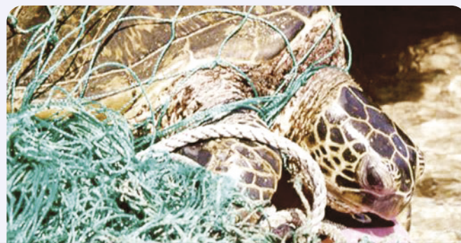
Tortue dans un filet de pêche