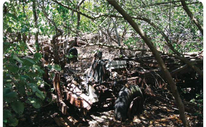
Une carcasse de véhicule (ferraille mais aussi plastiques !) dans une mangrove du côté de Port Laguerre.