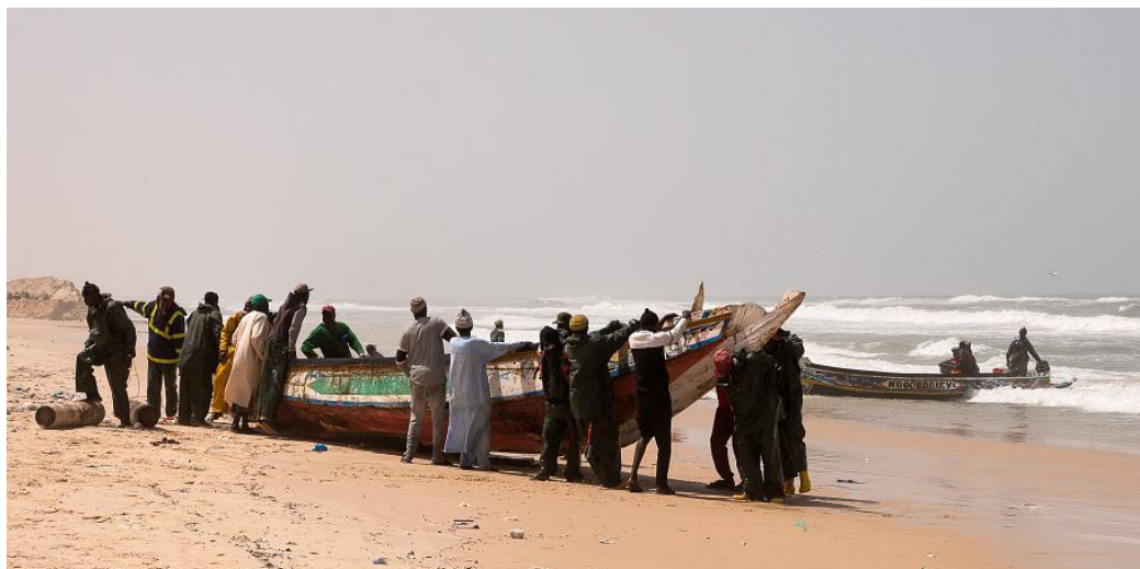
Pêcheurs au retour de pêche, langue de Barbarie. Saint-Louis / Sénégal