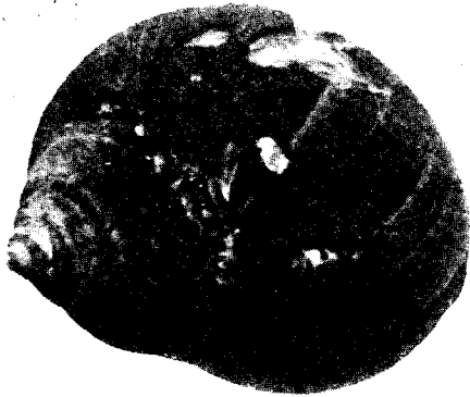
FIG. 1. — Bigorneau attaqué par Polydora ciliata , avant la cassure de l'apex.

changement et dans les mêmes conditions, à présenter la même altération de la coquille, il n'a pas été difficile d'identifier ce ver destructeur : c'est Polydora ciliata (George JOHNSTON 1838).