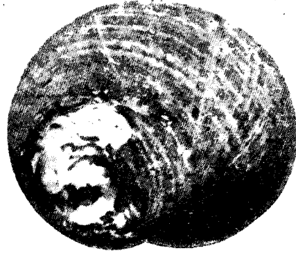
FIG. 2. — Suite de l'attaque du bigorneau : cassure de l'apex.