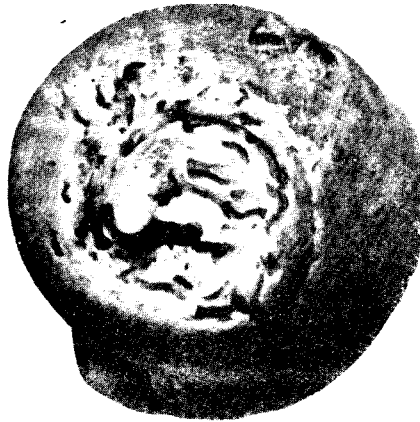
FIG. 3. — Bigorneau à apex brisé avec formation d'un apex cicatriciel.

Cette annélide a été maintes fois décrite sous des noms divers; le naturaliste hollandais Martin SLABBER (1772, p. 51-55, pl. VII, fig. 1-2) en a donné une description sous le nom de « Scolopendra marina tentaculis cornu-formibus » sans toutefois reconnaître qu'il s'agissait de l'espèce déjà observée par SWAMMERDAM. Depuis lors, le nombre des références concernant Polydora ciliata (JOHNSTON) est arrivé à dépasser une centaine, avec au moins dix noms synonymes.