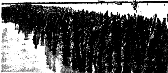
Piquetages au niveau des bouchots.