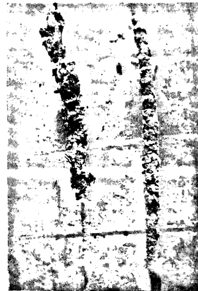
Piquetage de 11 mois (à droite) et de 23 mois (à gauche).