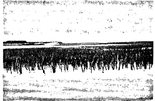
Piquetages au niveau de la pointe N.-E. de l'île Madame.